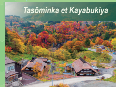
Tasōminka et Kayabukiya