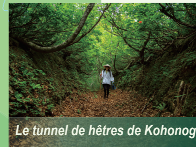
Le tunnel de hêtres de Kohonogi