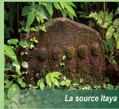
La source Itaya