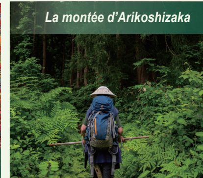
La montée d'Arikoshizaka