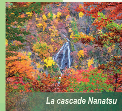
La cascade Nanatsu